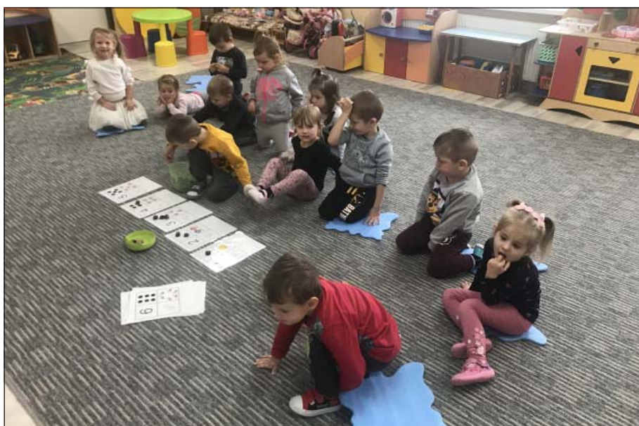
Počítanie gaštanov v triede lienok