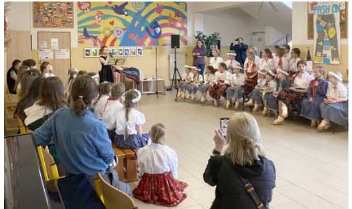
žiaci z krakovskej školy na návštevu našej školy, obce a regiónu Orava.