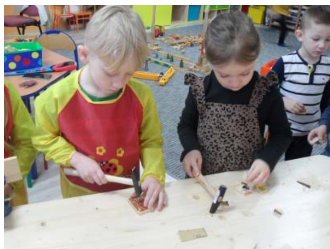
Pracovné zručnosti detí