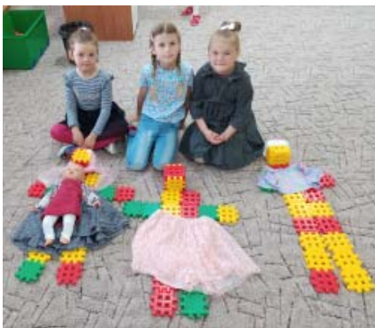
Deň matiek zhotovenie rodiny zo stavebníc