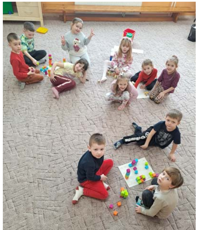
Sovičky sa učili počítat