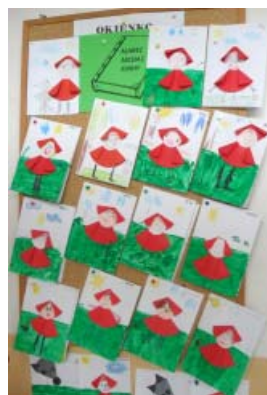
Rozprávky a výroba knihy