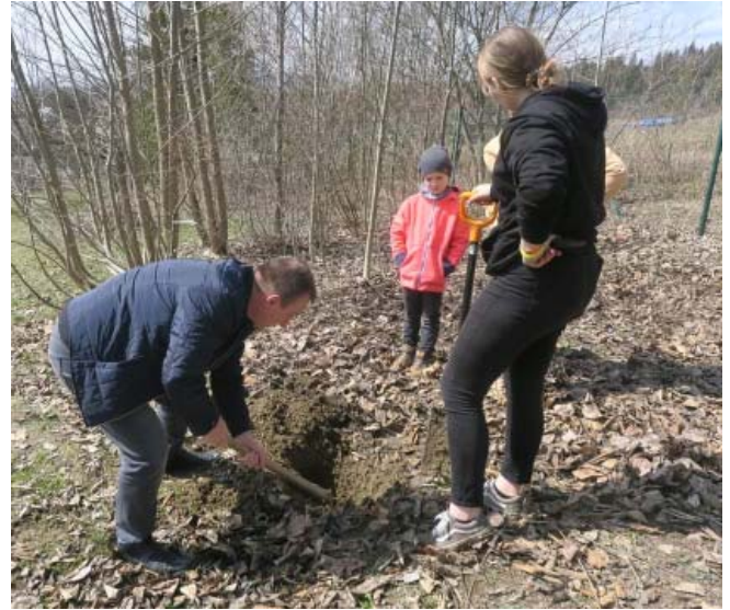
Sadenie lípy v Rabčiciach starostom obce

Kompletizáciu a úpravu knihy zabezpečili žiačky Strednej odbornej školy podnikania a služieb v Námestove.