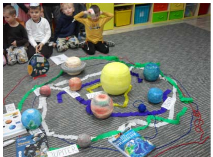
Učíme sa o vesmíre