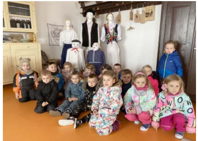
Návšteva Pamätnej izby