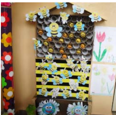
Poznávali sme život včiel, náš úl