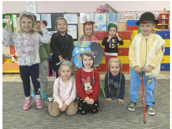
Divadielko O rukavičke