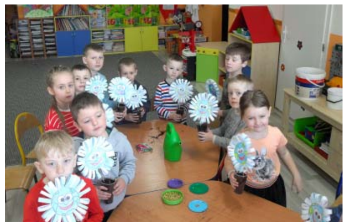
Ako sa ja starám o Zem