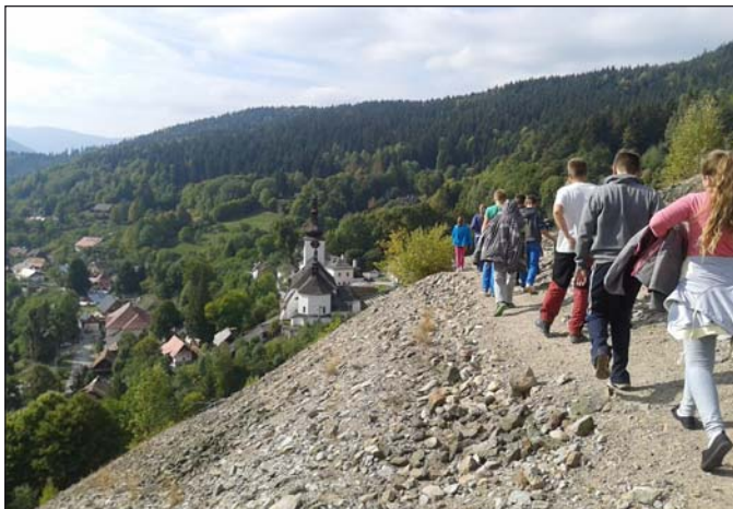
Prechádzka po halde v výhladom na Španiu Dolinu.

Druhou zastávkou bolo pútnické miesto „Staré hory“. Bola prvá sobota v mesiaci a tá býva vyhradená pre pútnikov – Fatimské soboty. Svätá omša bola v prírodnom areáli na Studničke. Boli sme prekvapení, aké tu bolo množstvo pútnikov.