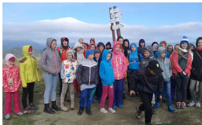
Vrch Zvolen – 1402,5 m nm.

Počas Babieho leta sa nám podarilo zrealizovať výlet, ktorý sme chceli uskutočniť už vlni, ale pre nepriaznivé počasie sme ho na poslednú chvíľu zrušili. Počas slnečného sobotného rána sme mali krásne pohľady na krajinu striedavo zahalenú hmlou a zaliatu slnkom. Z hodín geografie vieme, že tento jav sa nazýva inverzia.