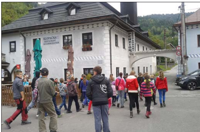
Námestie v Španej Doline – začiatok náučného chodníka.

ktorý vedie sedačková lanovka. Väčšina detí sa lanovkou neviezla, tak som zvolila tento spôsob dopravy. Deti boli nadšené, ako kabínky naberali výšku. S niektorými sa v kabínke viezli aj paraglidisti s obrovskými batohmi, v ktorých mali zbalený padákový kizák. Po vystúpení z lanovky sme si prezreli panorámu krajiny a podľa panoramatic-