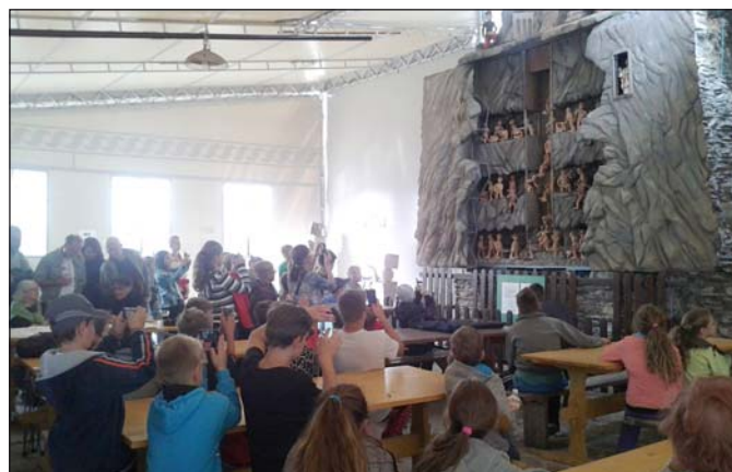
Unikátny banský orloj.

Prvou zastávkou boli Donovaly. Toto lyžiarske a turistické centrum Slovenska je deťom známe ako miesto, kde sa nachádza rozprávkové mestečko Habakuky. Naším cieľom bol najvyšší vrch Zvolen, na