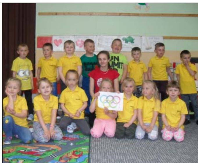
Výlet dětí MŠ do okolí na závěr školského roka