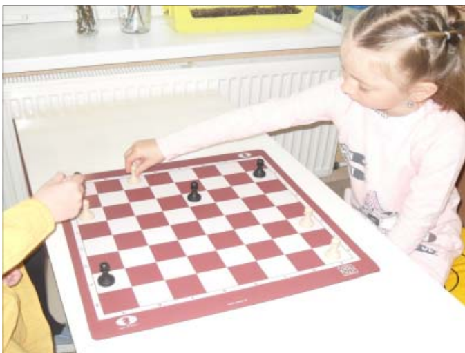
Projekt Šach v MŠ a jeho začiatky