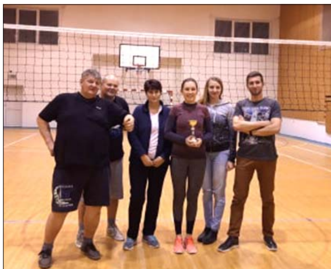
Družstvo Hraj pre radosť

O občerstvenie bolo postarané. Hráči si pochutili na chutnom kotlíkovom guláši. Všade vládla dobrá atmosféra a každý si pochvaloval športový deň.