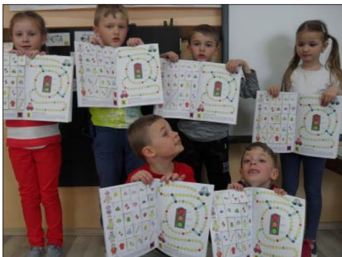
Pracovný zošit z projektu Medvedík Nivea