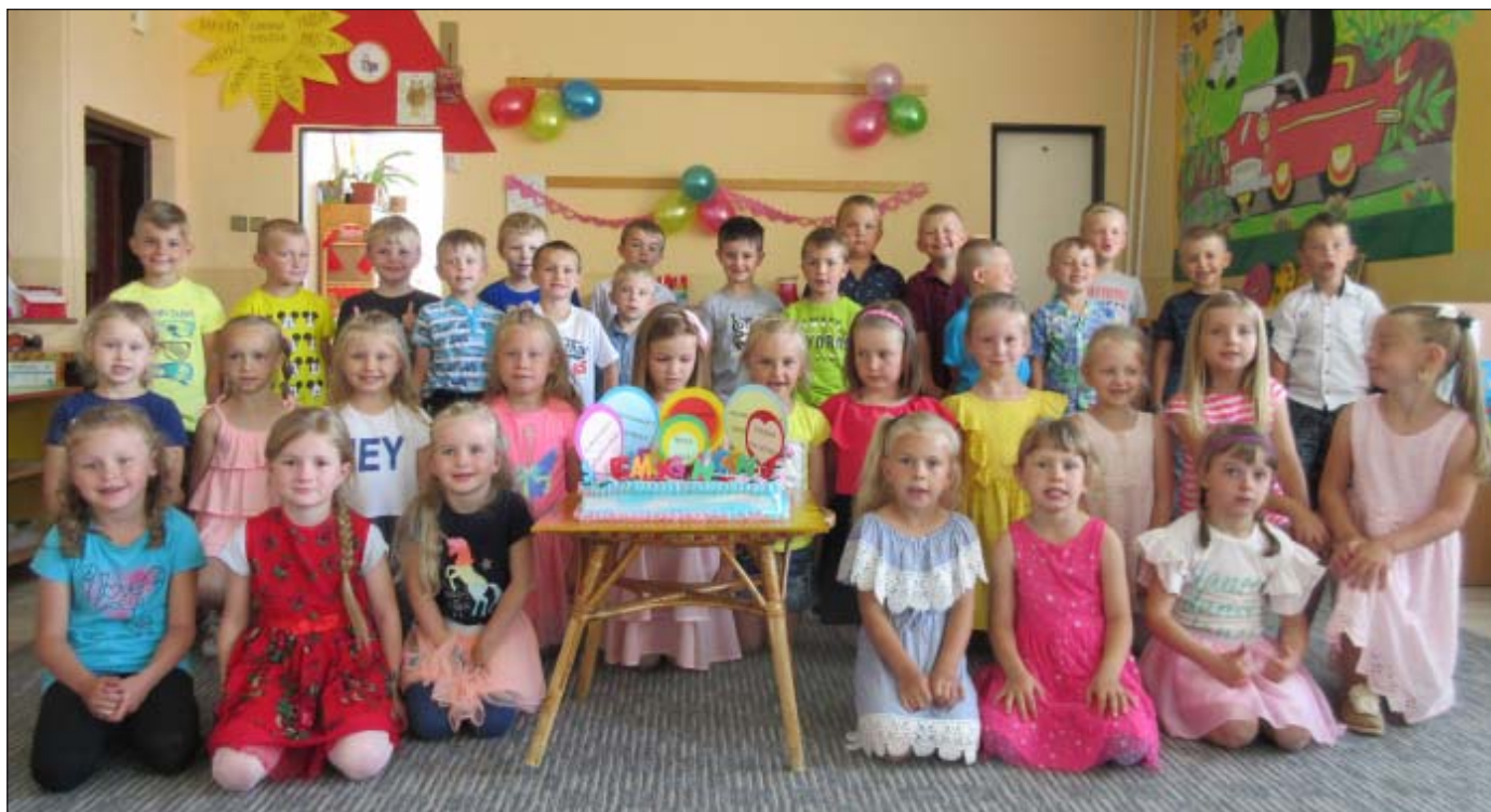
Rozlúčka so škôlkou a hurá na prázdniny