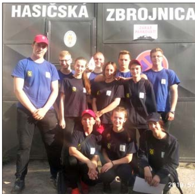
Na súťaži v Lokci