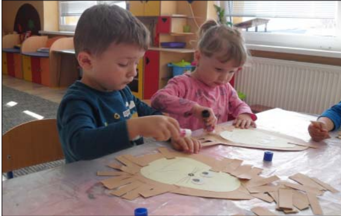
Jeseň v MŠ – takto pracujeme, a tvoríme ...