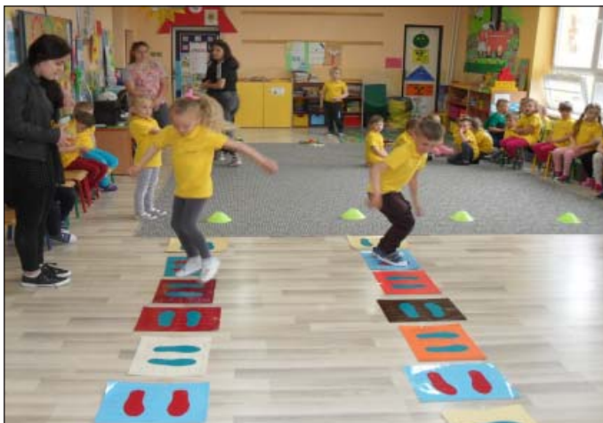
Takto deti súťažili v minulom školskom roku